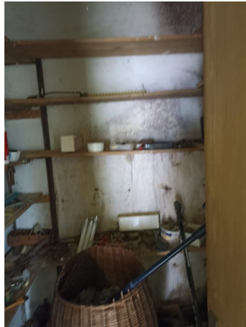
Byt v 1.NP - kuchyně