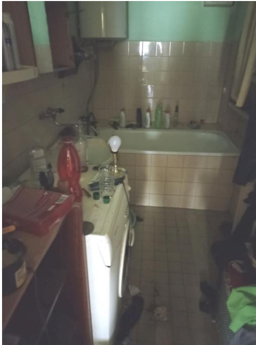
Byt v 1.NP – koupelna